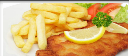
Plate Kipschnitzel Hawäi ( met kaas en ananas ) 16,95

met gebakken champignons, ui, bacon, gebakken ei, gegratineerd met kaas