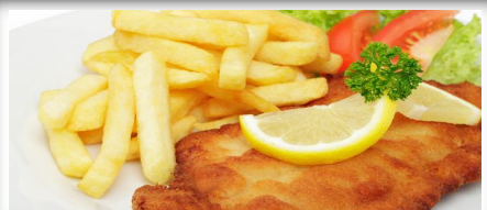
Plate Kipschnitzel Hawäi ( met kaas en ananas ) 18,95

met gebakken champignons, ui, bacon, gebakken ei, gegratineerd met kaas